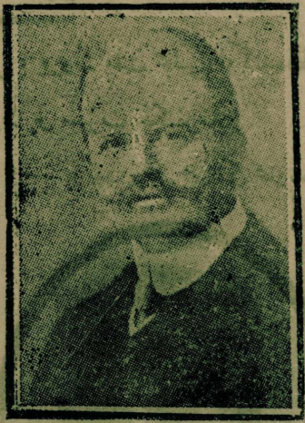
آمریقانك حربہ دخولندہ بو بوک بر تائیری اولان آلمانیا خارجیہ ناظر اسبقی

ویلسونک حيات سياسيه سنك بزى علاقه دار ایدن قسمی آمریقانك حرب عمومی بہ اشتراك ایتدیکی تاریخدن باشلار . بناء علیہ تفرقه مزہ آمریقانك حربہ کیردیکی تاریخدن باشلاہجفز . فقط آمریقانك حربہ کیرمہ سندہ کی عواملی آکلامق ایچون بو تاریخدن بر آز اول آمریقانی اشغال ایدن مسئلہلری تعقیب اتمک لازمدر . آمریقانك