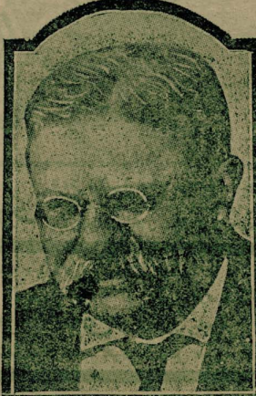
ساقى آمىرىقا رۇس جىمهورى (روزولەت)

لوزىتانىا واپورىنىك غىرقى و آلمانلار طرفىدىن مىركوزلەدە سىفىتى خىرىبە قازىنى وانىم اولان ئىموزات آمىرىكە عومىمىيىسى اوززىندە تا ئىزىرىنى كىمىترىكە باشلادى . بو ئىموزلە قازىنى ماقىلە اىنىك اىچون آمىرىقانىك لازىم كىن استىحضارلاندە بولوتامىسى هر طرفىدىن طلب اىدىلبوردى . رۇس جىمهور و مىجلىس مېموزان و اعىبان بلا اىنقاع صىرە صىرە كىن بو مابللر دولابىسىلە عادتاً بىزار اولشلىدى . ساقى رۇس جىمهور روزولەت كىنزال وودس اىلە بىر اىر بىر جىمهورىنى عىسكىرىك قانىنىك قىرازە آلتىمىسى ومان تىلپىق اىدىلەسى اىتورىلدى .