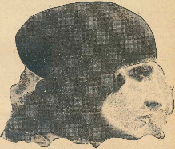
ضالمة ادیب ضائم

بو بو بوک و عمومی اسمی قبول ایتدکن صوکرآ ، اعتراف ایدیم ، اوهوز لریمه دوشنه بوکک عظمت و هیبتی آلتنده بر مدت بو جالادم .