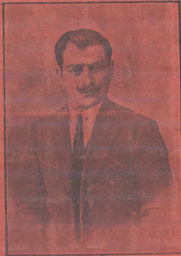
صاحب و ناشری : عودی ارنیک زاروراده

آدرس : استانبول ملاحه المیرا قاضی ۲۲ نوروزلی استقامت درستی مقامه ی