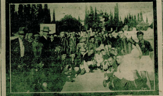
بارمکله برنجی سوزماندیره استیجاتان بومندوفا طاقی ایدنه قرانغنک (س.ق) طاقی برنج ایلرودوت سامیاله بارمکله ایلر

رئاسه شهر (موضوعی خبرنامه) — جلسه علینک قبول یوردنی تأجیل مجازات فانونک اعلان دولایسه مختلف عشرتورؤسانی شهر کلرک وراثت خلقنده اضیامیه بیوک پرکنه خاندن «باشاسون تورکی» جمهوری وباشاسون غازی «صدالری بیاره یوسکلدرک بیوک برسرود ایدنه شهری دولاشندن سوکره باراظر وداوول وچانلیله حکومت دارنمک اؤکنده باشاسون صدالری و آقیشلری تکرار ایشلردر . درحال مأمورن حکومت پوظله ارضی تقدر و سرورلرته اشتراک اوزره عرض استیوان ایدرنک یانلرته کلرک ده پواشتراکی آقیشلره فارشیلانمشدر . خاک عصمتک طرفدن برطق اراد اولوشن ، جمهوریت اداره رنشینک آشایش ، عمران واستراحت مملکت اولدنی بر چوق دلایله اثبات ایدلرکدن سوکره هرولنداشک