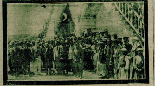
رئاسه شهر حکومت قرانغنک ارکنده عرصه مراهات ایدرنک الظهار سروری

برهوق عشرت ترک رؤاسی عرصه استیوانه ایشمار وکندیله نلازم کلن نصیحتلر ویرلشدر ..