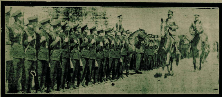
اتفاق قرال حضرتلى تورك جمهورى اولدولريك جايله . يئق دجايله . جدول كنج ناملرلى نقش ايديبورد

منهزم ديكتاتور مانچ سولون بولوندىي هفتده تامينات وريش ، لکن يكيندن غربتى تاريخى هفتده بريشى سوبيله مملكتى بيان ايتدرد . ( چانغ سولون ) ك خاشاك عمومى سوزنده خطباي آس بر تمام تلفراف عامه حاضر ايدمده اولدى . من اولونمى . يكينك خطباي زمانه مخصوص رسالت عموميه قوميت مسلك تكميلكى ايچون حاضرلى بلاشتمدرد . لوندرد ، 2 (آ.آ) - « ده لى مبل هاك توكو بخارى بيلدريورد : يكينده كى معلومات