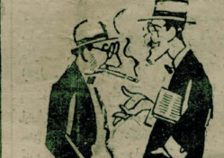
— بوکونی ملائیک زده بلیک — — تراولده 1915 —

بلا تقربن حقوق مساوی اولوب قطعاً امین اولری و حکومت جمهوریتک یکنه مدتک حق و عمران اولدنی آکایلمشدر . علاوه طالعده حال فرارده و تورکی جمهورتی حدودری خارجده سفل و برشان یشانغناک مقرندن و مقرنت بالکتر یولک اوزکب ایدرنه معظوف اولدندن دولایده کمدود ملی خارجده و داخلده تورکک یکس رفرینک یله تقدر امامستک بورالکده اک معزز اک مدنی عملکترکی اومشک ، باشده منجی بیوک غازی خضرتی اولدنی حالده حکومت جمهوریمیزه اک بیوک غایه بولوندی اسباح ایدلشدر .