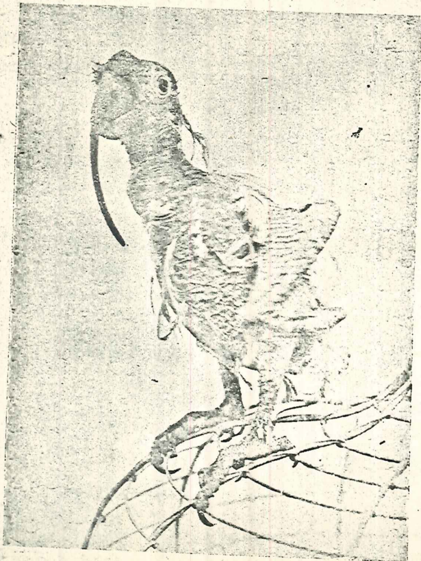
( ١١٧ ) یاشنده برپایاغان