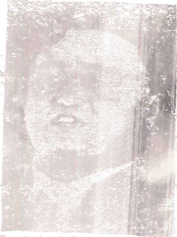
Komünist Bulgar hükûmetinin Başbakanı Dimitrof

kullanmak istedikleri, mülteciler iade edildikleri takdirde Türkler