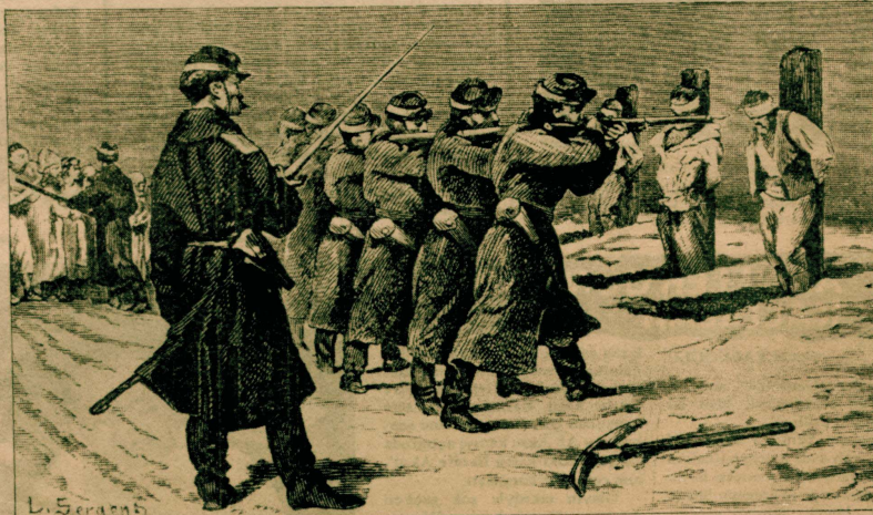
Ruslar esir düşen Türk askerlerini nedense hemen kurşuna dizmekte maharet sahibiydiler. Yakalanan kahramanlar direklere bağlanıyor ve önlerine kazılan çukurlara atılıyorlardı. Bir Avrupalı ressamın kaleminden çıkan bu temsili resim bu feci anı gösteriyor.