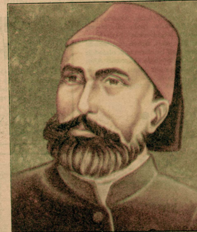
Mithat Paşa sanmıştır ki, Anayasa yapılar yapılmaz Batılilar Türkleri kendi saflarında ve eşdeğerde bir ülke olarak kabuleneceklerdir.

İşte anayasanın ünlü 113. maddesi. Mithat Paşa daha sonra bu maddeye dayanarak muhaliflerini sürdürmüş ama kendisi de aynı maddeye dayanılarak yurt dışına çıkarılmıştır. Bu maddenin ikinci fıkrası aynen şöyle diyor: Hükümetin emniyeti ihlâl ettikleri idare-i zabıtanın tahkikatı mevzu kesil/Devletli soruşturma/ üzerine sabit olanları memaliki-i mahrusa-i şahâ-neden ihrac ve teb'id etmek münhasıran zat-i hazret-i padişahınin yed-i iktidarındadır..."