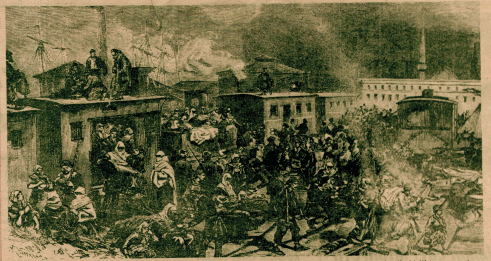
Avrupa'daki Türklerin ilk büyük göçü bu savaşta başlamıştı. Giden vatan parçalarında yabancılar ile birlikte yaşamak tansa, soydaşlarımız herşeylerini bırakıp o zamanın trenlerine binerek anavatanına gelmeyi yeğlemişlerdi. Politikamızın çirkinini sonunda 1912/13 Balkan Savaşı'nda da yüzbinlerce göçmen İstanbul'u ve Anadolu'yu dolduracaktı.

YARIN: Kumanda birliği olmayan bir cephe