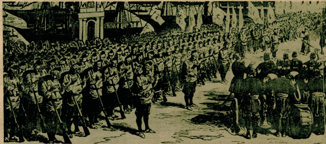
Kafkas cephesinde Sohuma çıkan Türk birlikleri cepheye hareket etmeden evvel sahilde beraberce zafer duası ediyorlar.