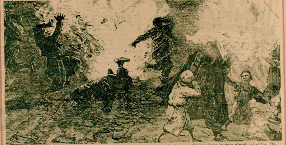
Ruseuk bir Türk şehri olmuştu asırlar boyu. 93 veya 1877/88 savaşı başlayınca Ruslar önce burayı almak istediler. Ordularımız arasında kumanda birliği de olmayınca burayı ele geçirdiler. Ama geçirmeden evvel ellerindeki büyük malzemeye güvenerek şehri evvela ağır şekilde obüs bombardımanına hedef yaptılar.