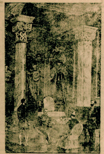
Yesilköy'e kadar gelen Rus ordusu Baskımandan Prens Nikolayev'e bu arada, daha bir senelik hükümdar olan Abdülhamid'i de ziyaret ederek kendisi ile görüşmüştü. Bu acı hatırayı Abdülhamid ne şekilde muhafaza etmiştir bilmeyiz ama, Rus kumandanı daha sonra Çar'a "Doğruyu karşısında sanki yenilmemiş bir ordunun padişahı gibi konuştu" diyecektir...

İk Anayasa kabul edildikten sonra yabancılar Türkiye üzerinde her miliyetten bir devlet kurma hayalini benimsemişlerdir. Bunun en kısa yolu, toprakları yabancılar adına tapulamaktan geçmektedir. Mesela 1895 yılında Ermenilerin Urfa ve Harran Ovası ile Çukurova'daki bereketli toprakları köylülere veya beylerden alıp kendi adlarına tapuya tescil ettirmek için harekete geçtikleri, sarayda duyulur. Abdülhamid'in gerçekten son derece mükemmel işleyen istihbarat teşkilatı haberini kendisine ulaştırır. Padişah kimseye sormaz, hatta Sadrazamı ile bile konuşmaz. Ora valilerine ferman gönderilir. Bütün topraklar en kısa zamanda Padişah adına tapulanacaktır. Gerekli para hükümdarın kendi özel kasasından ödenir. Rusya ve İngiltere'den mali destek sağlayanlar niyetlerini gerçekleştirmek için tapu idaresine geldikleri vakit, görüldükleri arazi hükümdar adına kayıtlıdır. Saltanatın lağıvından sonra devlete intikal eden bu topraklar üzerindeki mülkiyet tartışması hâlâ sürüp gitmektedir.