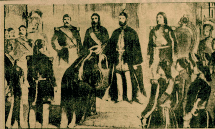
İstanbul yıllar sonra ilk defa Abdülhamid'in cülus merasiminde yeni bir kılıç alayı seyretmişti. Abdülaziz'in resimde görüldüğü gibi merasımı yapılmıştı. Daha sonra 93 gün saltanat süren Sultan V. Murad için bu tören yapılamamıştı.

ama, bir süre sonra karşına, zaman kazanmış bir hükümdar ve direnişinin sadece kılıfını değiştirmiş bir başka saray adamı çıkıyordu. Kaybeden ben olur yordum..."