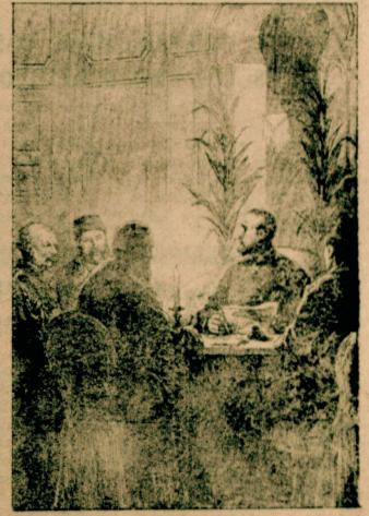
Edirne'de Ruslarla Osmanlı Heyeti arasında başlayan bugünkü deyim ile ates-kes anlaşmasının hazırlık safhasından görünüş...