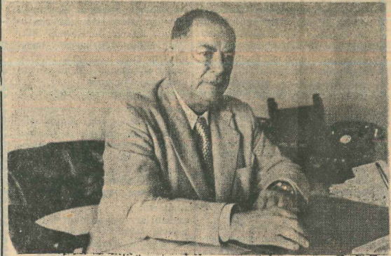
Dün yeni vazifesine başlayan Sağlık ve Sosyal Yardım Bakanı Ekrem Hayri Üstün dağ makamında