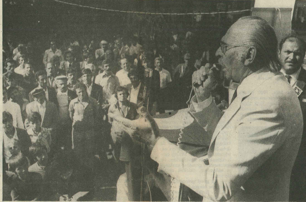
AYBAR BİR MİTINGTE — Mehmet Ali Aybar 1973 yılında TBP'nin Alibeyköy'de düzenlediği bir mitingte konuşurken. Aybar, "Halk artık 1950'lerin, 60'ların, halkı değil. Bugün herkes politika konuşuyor. Belirli bir bilinç düzeyine geldi halkımız" diyor.

U. MUMCU — Karar nasıl karşılandı, etkisi ne oldu? AYBAR — Kararın yaptırım gücü yoktu elbet. Biz uluslararası hukuku, anlaşmaların bu konudaki hükümlerini dile getiriyor ve