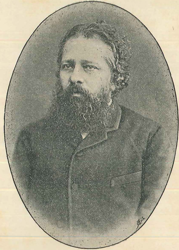
محمد نامق کمال - ۱۲۵۶ - ۱۳۰۶