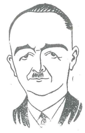
Galip Kemal Söylemezoglu