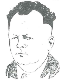
Profesör Mustafa Şekip Tunç