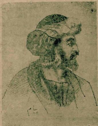
قانونی سلطان سلیمان خان حضر تلی

استیلا ایتدکری خریستیانلره مخصوص اراضی نی استرداد ایله مک داعیه سیله ده مسلمانلره اعلان حرب ای دیله بیلردی و بو دشمنلره قارشى هر واسطه نی قوللاقمق ، حتی اعصابولته بیله مراجعت ایتک مشروع ایدی . دیمک ، خریستیانلره مسلمانلرک حرب و ضربه بر برینه قارشى معامله لری بویله نی - رحانه ایدی ، بریکلر بوجدا ل وقتلده او برلینه نسبة داها زیاده رفیق ایله داورانورلردی . هر حاله مسلمانلره خریستیانلر آراسنده بو حرب و ضرب اکثریا مفرط ، وحشی بر شکل آلدی ، حتی مرور زمان ایله هرایی طرف بیننده مناسبات منتظمه تأسس ایتدیکی وقت بومناسبتلر خریستیان ملت لرک بر برینه قارشى مناسبتلرینه بکزمه یوردی ، آزاده بویوک برفرق واردی . اویله حکم اولونیوردی که حقوق بین الملل آنجاق خریستیانلر ایچون مرعی ایدی ، مسلمانلره مناسبات آنجاق