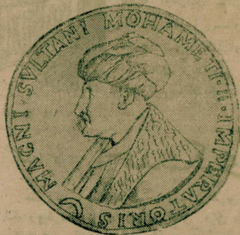
فاتح سلطان محمد خان حضر تلی

مساعداً مذهبیهك فتوحات عثمانیه ایچون فائده لری اولدی ، انكار اولوناماز ، مثلاً بوسایه ده ، اولجه عرض ابتدیکمز کی ، روملر تورک حاکمیتنه لاینلر ککنی ترجیح ایله دیلر ، ینه بو سایه ده فتحدن سوکره