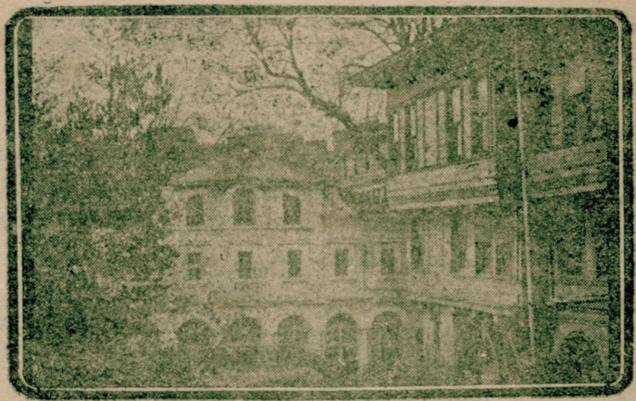
مصلردن برى توركله قارشى براهانت اوجاننى تشكيل ايدن و نهايت برونانلى پاپاسه مقر اولان فنار پطريقخانهسى

دها چيلفين وازدهاملى برمنظره ارانه ايدىوردى. (خرونوس) ك افاده سنه نظراً انكلاز باراغنى ويزانس علامتنى حاوى اولان پطريقك استمبولى