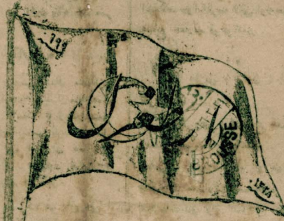
منابع وطنه غلام هفنده دایکی، دهمه نشر اولور سیاسی تورک فرانسیدور

(دمیرچی افه) دن شبعدی آلتان نغرافته ازمیوک تلمیسه قوزاسمه تقرر و یونانیله بیلغ بدلیگی یادر بایورد. ایتالیا آزانی - ۲۰ شیطاط - و مایزه نولک تراکیا و عرق آملطری حقه مک مدهیاتمی مجلس ملی رد ایشدور. ۸ انگیز اشفانده بولنک (موصلی) ملی قوتلر طرفندن سقوط ایندر ایشدور. ۹ کلیس - هیئتای بولی قواهی ملیه قبا شدور - کوزیرلر (اقچه قیونلی) (ملن) استانبوللری قاراسنمه ک خطوط تحریب اولمشور. اصلاحیه - مریش بولی اوزرنده دشک ۳۰۰ پیاده برطوب، ایکه مترالوزی و یا پرونده ۱۵۰ نرله ۱۰۰ آراهیمی محاصره آتته آلمشور. حرب دوام ایندیور. سپهره ک عشاری ده حربه شتاب ایشدور.