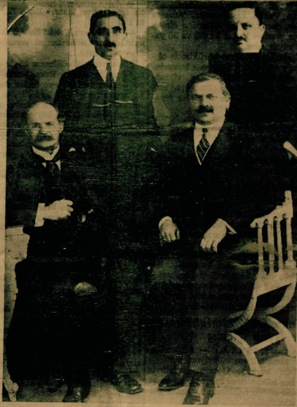
Son Sultanlığın son sınırlarından: Ali Kemal, Rıza Tevfik, Mehmet Ali, Reşat Halis

2 — İntihap muamelâtını karıştırmak için Anadolu'nun üç noktasında isyan çıkarılacak; bu suretle Sivas'taki Heyeti Temsiliye şaşırtılarak bu fırsatten bilistifade Hürriyet ve İtilâf fırkası namına rey toplanacak.