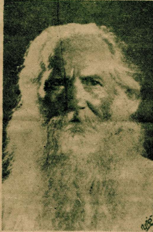
Rıza Tevfik 978-668-3

ilmi noktalar, hattâ istilâhlar sezil-ir. Lâkin onların ağırlığından azap çekilmez.