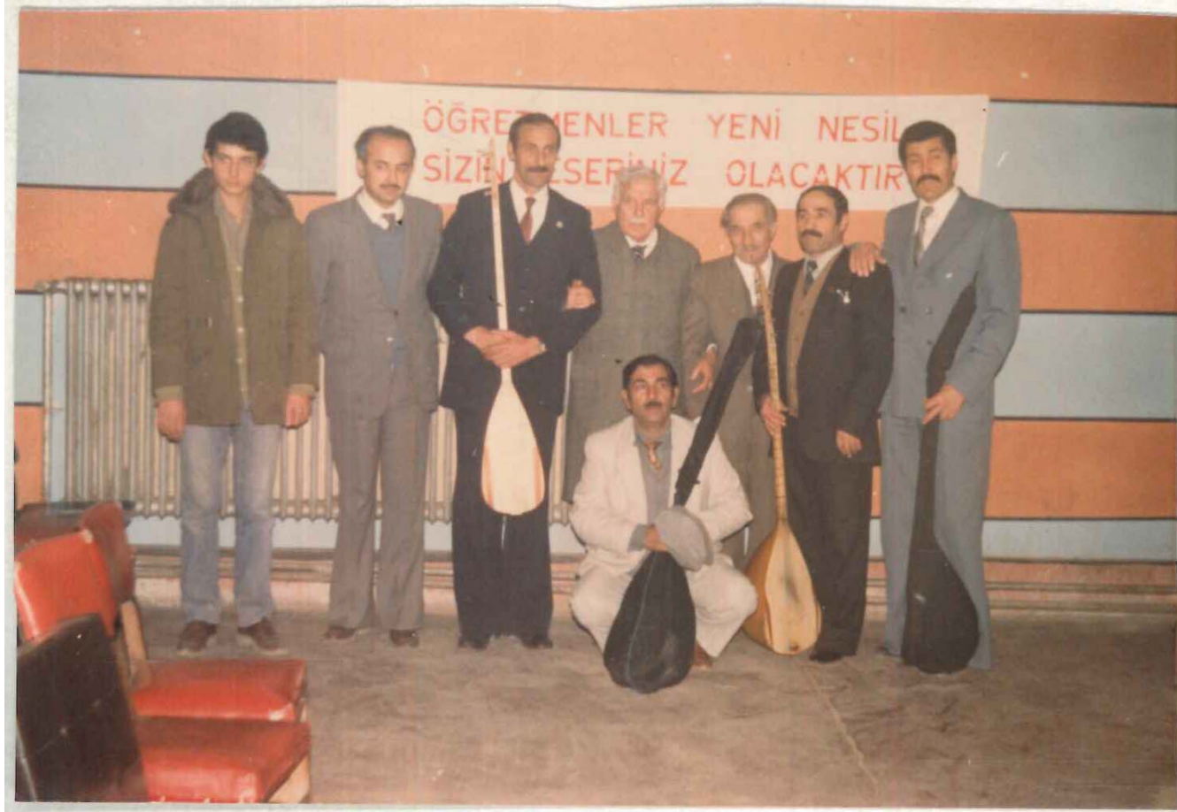
TÖVİSAM Kütüphanesi Arşivi No 056. 23/18