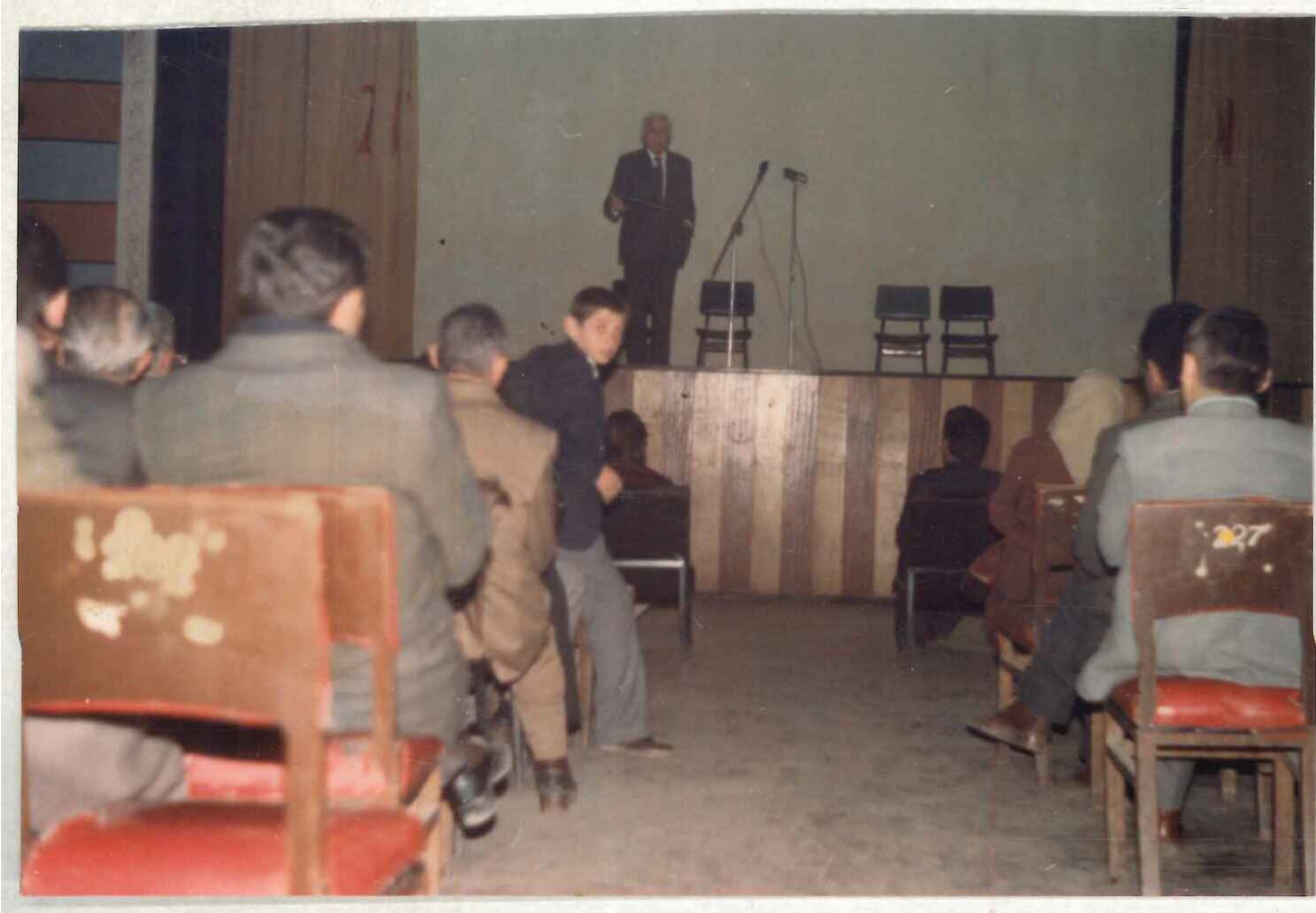
Ev ISAM Kütüphanesi Arşivi No 056.23/9