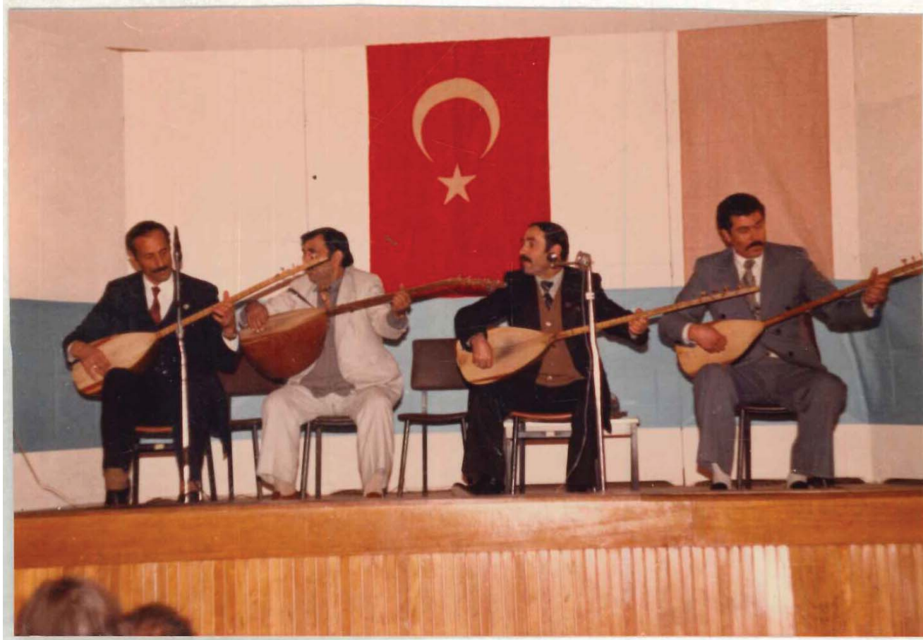
TDV İSAM Kütüphanesi Arşivi No 036.23/1