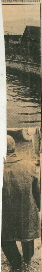
İnan Vali Ahmet yükseltti mesli