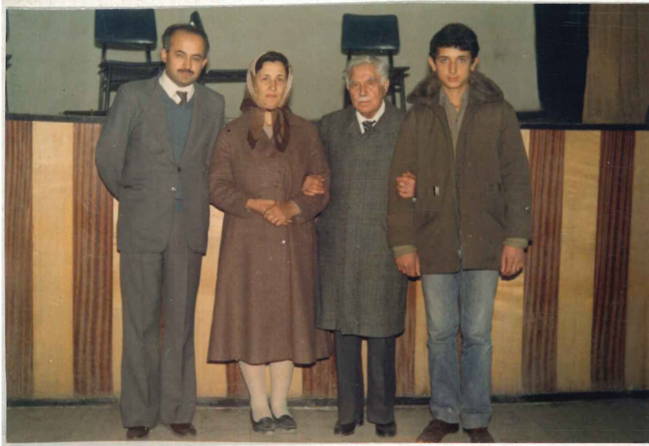
TDVİSAM Kütüphanesi Arşivi No 056.23/11