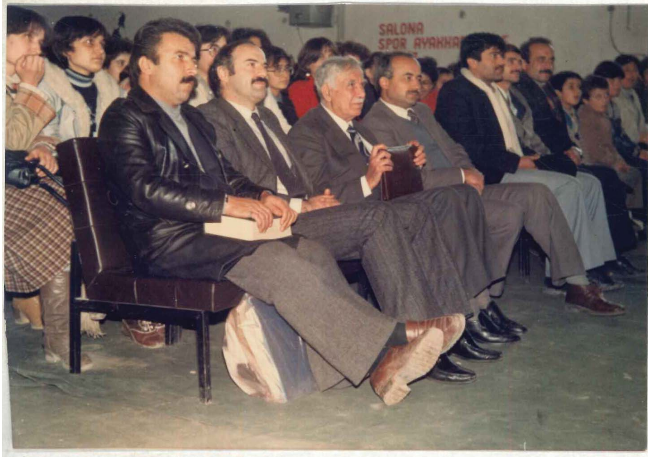
TDV İSAM Kütüphanesi Arşivi No 0Ş6.23/15