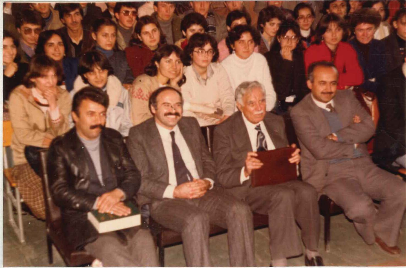
TDV İSAM Kütüphanesi Arşivi No 050.23/7