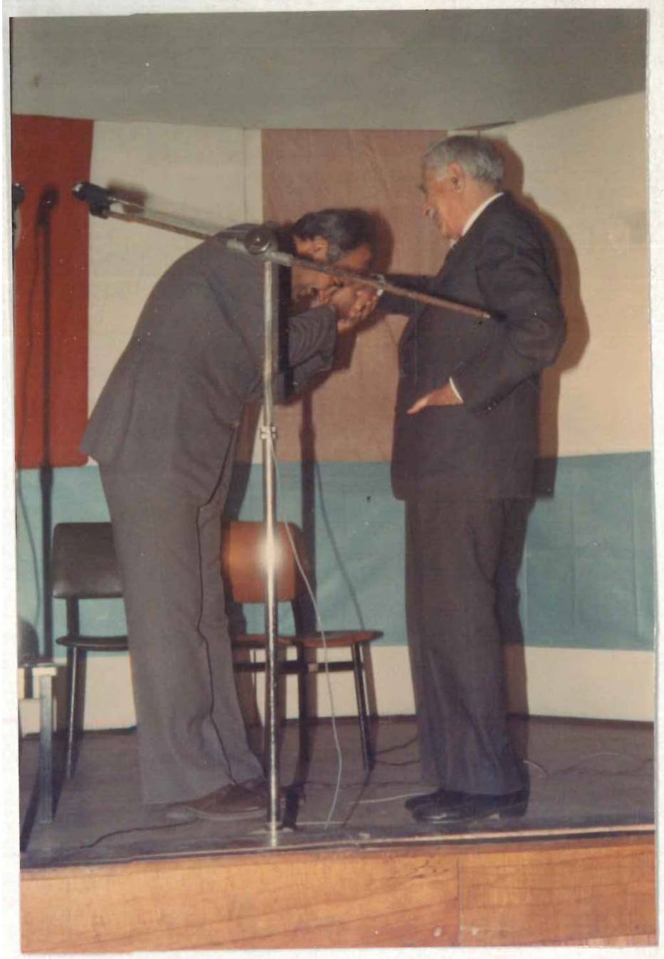
TDV İSAM Kütüphanesi Arşivi No 096.23/5