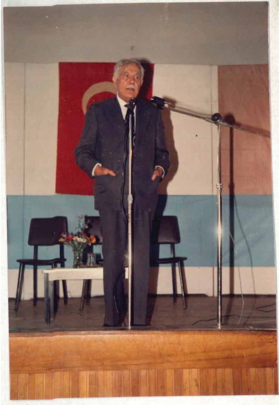
TDV İSAM Kütüphanesi Arşivi No 056.23/3