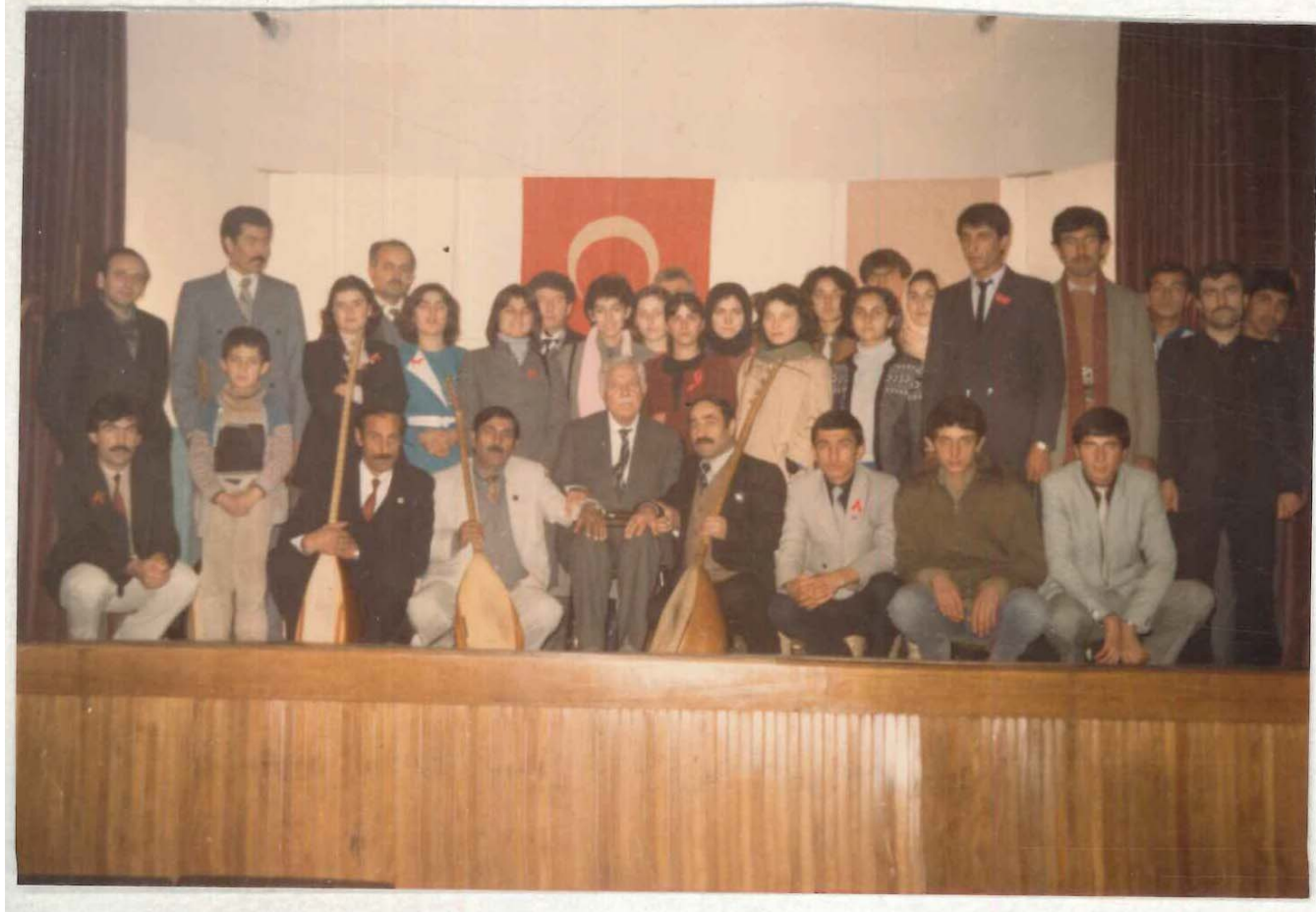
TDV İSAM Kütüphanesi Arşivi No 056. 23/14