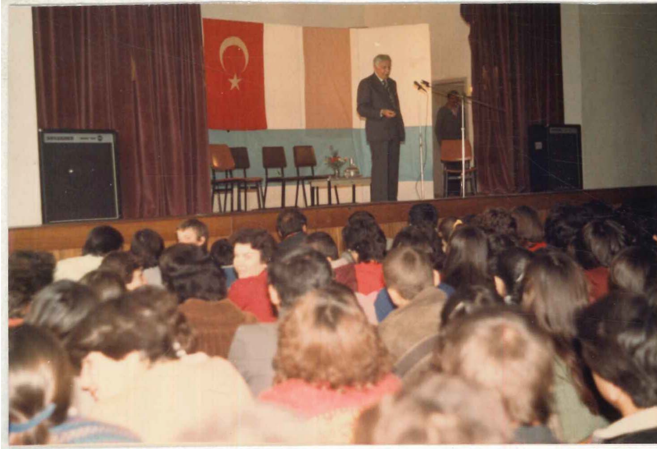
TDV İSAM Kütüphanesi Arşivi No 056.23/12