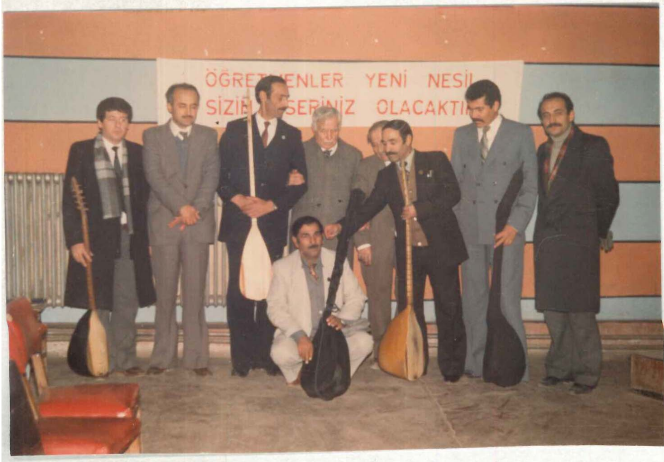
TDV İSAM Kütüphanesi Arşivi No OŞG.23/2