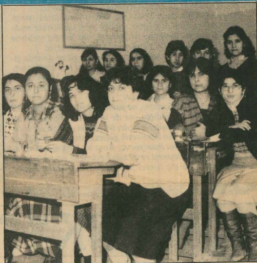
Kurs sonunda ilkokullarda açılan ana sınıfı öğretmeni olacak bayanlardan bir bölümü... (KÜRŞAT ÇELİKTÜRK)

Kastamonulu 25 genç kız anaokulu öğretmeni olmak için kıyasıya çekişiyor