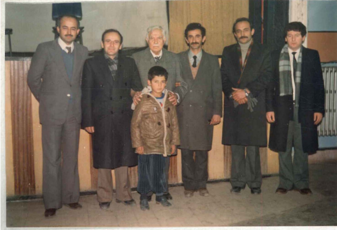
TÜV İSAM Kütüphanesi Arşivi No 056.23/16