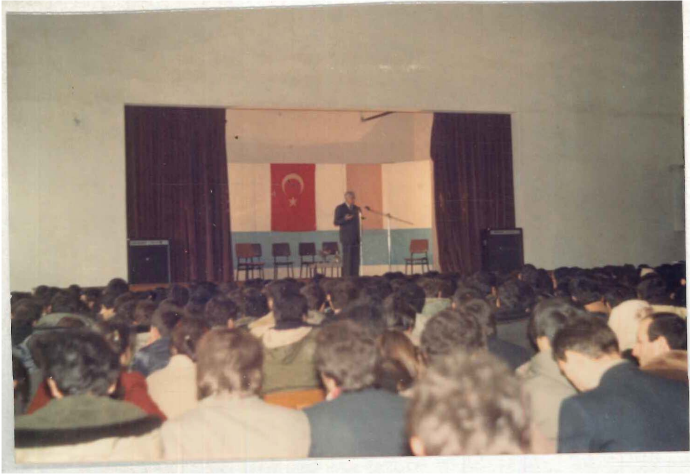
TÜVİSAM Kütüphanesi Arşivi No 0Ş6.23/8