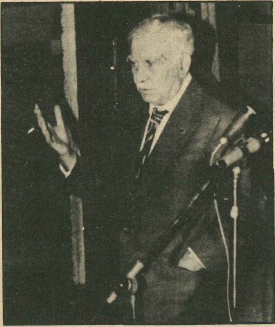
Kastamonulu büyük edebiyatçı ve şair Orhan Şaik Gökyay, Aşıklar Şöleni gecesinde yaptığı açış konuşmasında görülüyor.