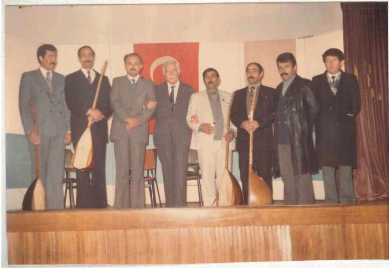
TÖV | SAM Kütüphanesi Arşivi No 056.23/17