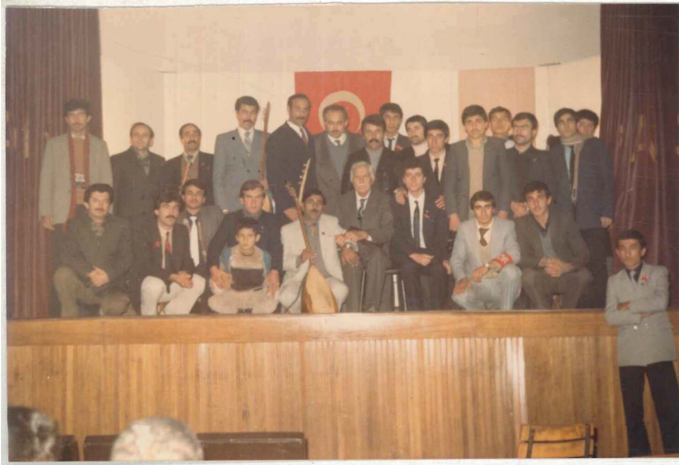
TDV İSAM Kütüphanesi Arşivi No 056.23/13