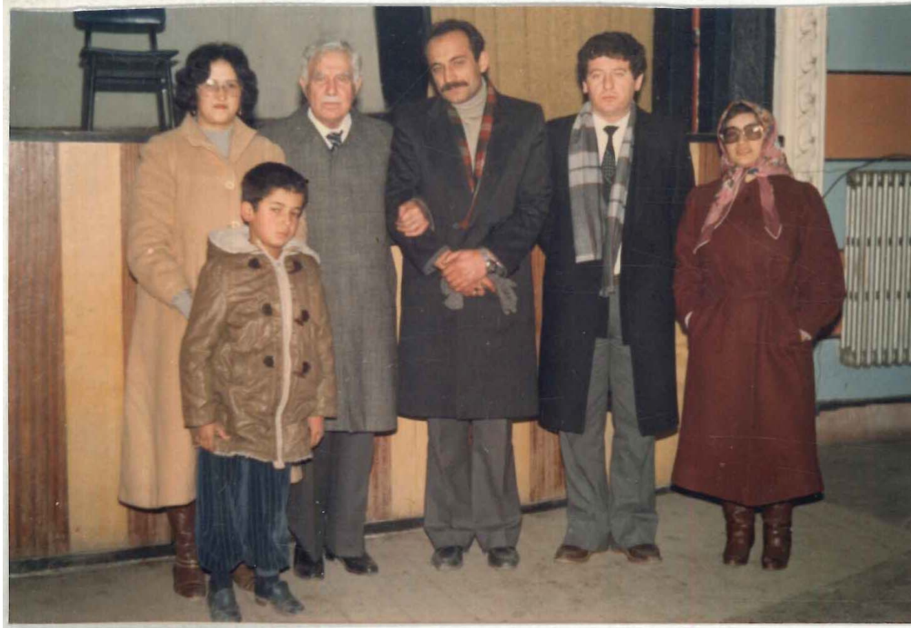
TDV İSAM Kütüphanesi Arşivi No 056.23/10