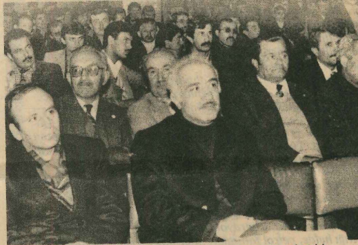
"Aşıklar gecesi"ne çok sayıda Kastamonulu yurttaş katıldı. (KÜRŞAT ÇELİKTÜRK)

İlk kez toplanan fiyat denetleme kurulu, bazı kararlar alarak, bu kararların tüketicilere ve esnafa duyurulmasını kararlaştırdı. Bu karar göre etiketsiz ve faturasız mal satan işyerlerine para ve kapatma cezası verilecek. Daha önce işyerlerinde mal bulunan esnaf zamlı mal alındığında beyanda bulunacak.