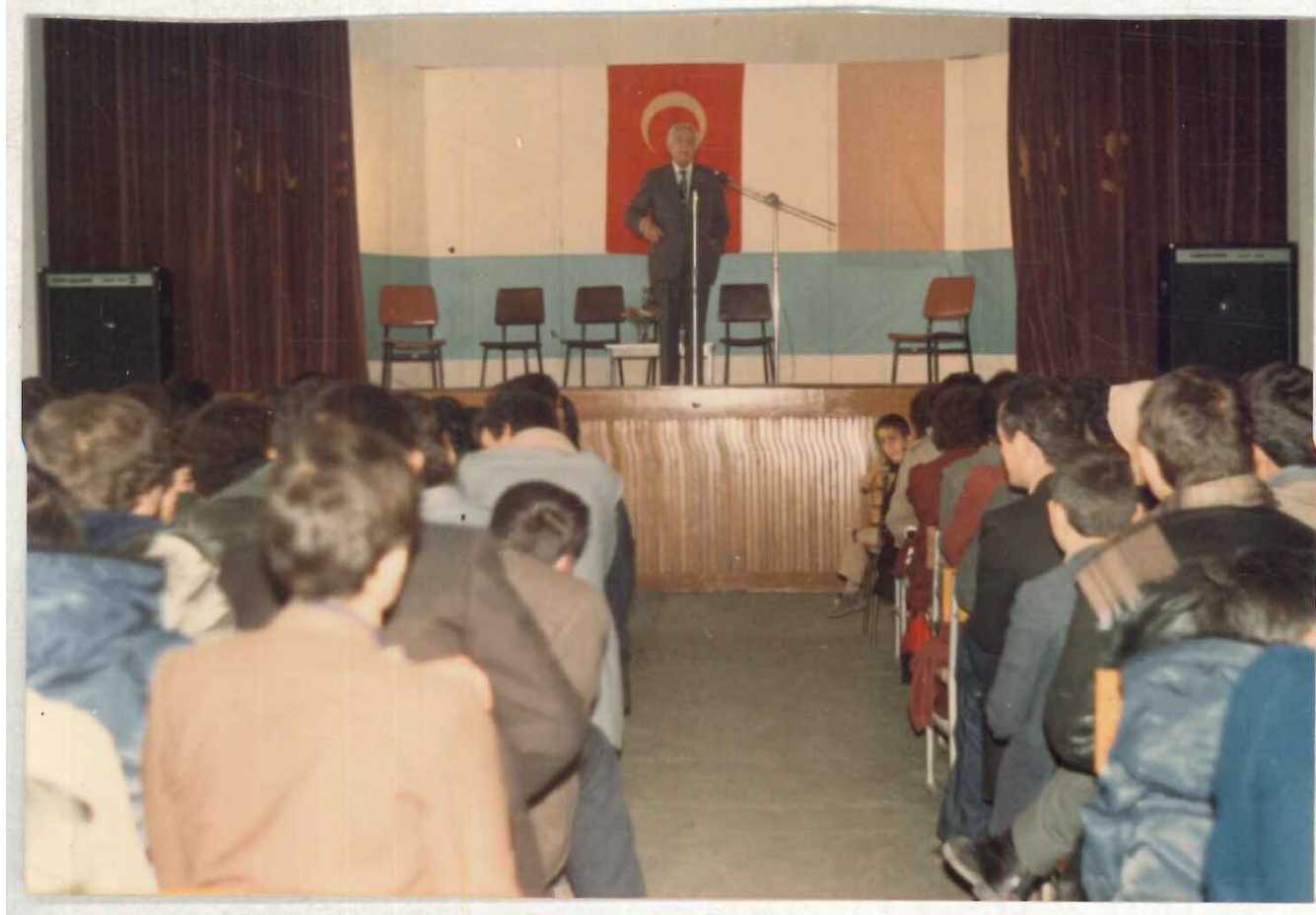
TDV İSAM Kütüphanesi Arşivi No 056.23/6