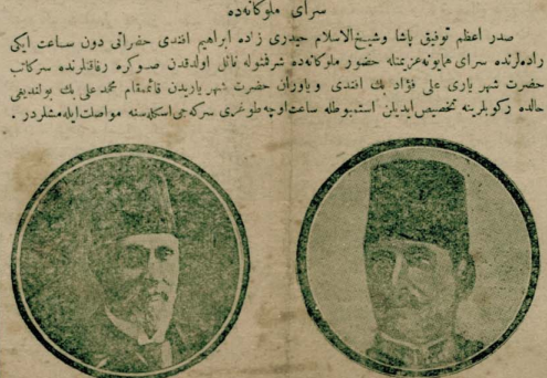
حريه ناظرى : عبيد پاشا سرداعظم : توفيق پاشا

سرداعظم پاشا و شيخ الاسلام حيدرى زاده ابراهيم ائدى حضرتى دن ساعت ايک زاده لرده سراى ماپونه عزيمته حضور ملوکانه ترنوله نالي اولدندن سوکره زوقلرده سرکاب حضرت شيرازى على فؤاد بك ائدى و باوران حضرت شيرازين قائم مقام محمد على بك بولندي ي حاله کور بونه تخميس ايدلن استنبوله ساعت اوچه طوعرى سرکهن استکلمنه مواصت ايله مشدر .