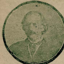
نسخه ناظری: نافع ناظری