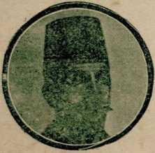
خارجیه ناظری: رشید پاشا