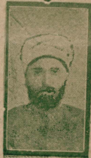
غزیه منه ایضاحات مهمه اعطا ایدن شیخ الاسلام

— ممالک مستولیہ تک خلافتله رابطہ سنی محافظه ایچون نه پایلمشدر ، نه پایلیور ونه پاییله جقدر ؟ — حکومت ، ممالک مستولاه ایله خلافتک رابطه سنی محافظه ایچون آجیلان اوچوروملری طولدرمغه ورنجیده ایدیلن حسابی مسایلرک تجزیه سیله وسائر صورتلرله تعمیر و ترضیه ایتک چالیشه جقدر .