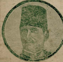
حربیه نظارتیه: عبده پاشا