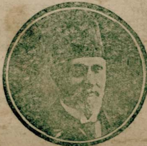
صدر اعظم: توفیق پاشا

صدر اعظم توفیق پاشا و شیخ‌الاسلام حیدری زاده ابراهیم اتندی حضراتی دون ساعت ایکی زاده‌لرده سرای همایون غزته حضور ملوکانه تشریفوله نایل اولدین صوکزه زوقلرندۀ سرکاتب حضرت شهبازی علی فؤاد تک اتندی و یاوران حضرت شهبازی فاعتمام محمد علی تک بولدینبی حاله و کولرینه تخصیص ایبدین استنبوله ساعت اوچه طوغری سرکاتبی استکسسه مواصالت ایلمشدر .