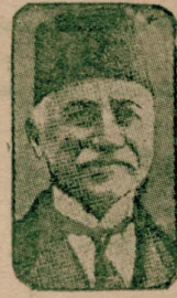
دوقتور جمیل پاشا

متعدد تکلیف و اصرار لره رغماً سیاسی بروطقیه در عهده ایتمکدن دائماً متوق و شهر امانتنده مشاغل کثیره دن صتم مختل اوله رق برای تداوی اسونجی ره به عزیمته منتهی ایکن صالح پاشا قایبه سنک وقوع استعفا سی و دولتک حکومتسز بر افاقق تهلکسنه معروض قالماسی اوزرنه نامه نظارتی و ولایتک مشولیت مشترکه سیاسیه سی