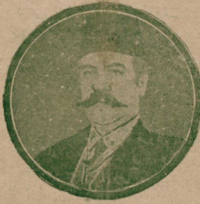
(آتانت) غزته سنه بيانده بولنان

بوايلك هيئت ناصحه اعزاي بر باشلانغيجدن عبارتدر . شهزاده عبدالرحيم افندي يى قيصه بر زماندن سوكره ديكرى تعقيب ايدجكدر . مملكه داخنده اوزون مدت قاهره تدقيقات يابه جق اولان فى هيئتلر تشكيلات اقتصاديه و تعميرات لازمه اساسلرني احضار ايدجكدر . ياره بك دريندر . اوفى صارمق ايجون المزدن كلى يهودوز و وفقى اولاجغوزى اميد ايدبورز .