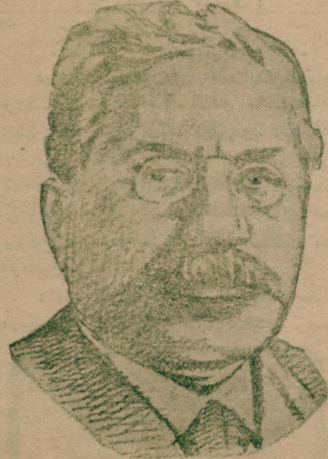
صلحمن حقدده فرانسه مجلس میعوانده ایضاحات و برن اشترکیل موسیو میران

ایضا حادتن فضله اولوق اخیراً مجلس میعوانده دخی بیانات مفصلده بولوتش ، بشابه جتی درجه ده قوتلی بر تورکیایه وجود و برلش ، ذات شاهانه تک استابوله اقباسی و فرانسه تک تورکیاده کی