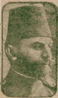
کنديسنه حربه نظارتى تکليف ايديان

حربه نظارتى اسويچرده بولونان محمود خنار پاشايه تکليف ايده سدر یکی قابينه اعضاسى دور دائره نظارتى کله در مأمورينك تبريكاتى قبول ايندکدن سوکره وظیفه لر مشغول اولمغه باشلامشدر . صدراعظم و خارجى ناظرى داماد فرید پاشا دون دائره خارجيه به کله در مأمورينك تبريكاتى قبول ايش وسافلى زمانند جريان ايش اولان معاملاتی تدقیق ايشدر . بوسيره