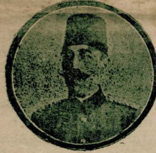
پوسٲه و تلفراف ناظری: اوسقان اتندی

جلس میبوتان دون ساعت اوچده خلیل تک ریاستده طولانده بقضیط سنا تک قرائت و قبولندن چکسکره رئیس تک کین ایجتاعدن بوکونکی ایجتاعه قدر بکین ایام آرمسده عزت پاشا قایم‌مسنک استعا آیدرک طرف شهبازی دن استغفان قبول و مقام صداری ایجان اعضاسندن توفیق پاشا تک تمیین