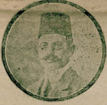
چور وکوسولی محمود پاشا ایچون قایمیه کیدریمی؟

استخبارتیه نظرآ، ایماندن چور وکوسولی محمود پاشا تک یکی قابینه داتل اولندن استکف ایچی، صرف عزت ککده وکلا مایانده بولوناستنددر. محمود پاشا بو قرارلری صدر جدیده سولدن و دیگر بعض طرفلرندۀ عین فکر دویمان ایلدکن صوکزه، توفیق پاشا داخلیه