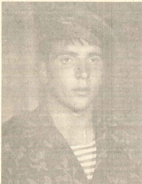
«Дүняда өн шөрөфи ад нөдир!» — деје сорсалар, төрөдүд өтмөдө — чаваб берөрдим: «ШӨНИДЬ». Ана

Вөтөн, догма торпаг үгүндө чанымы фөда өдөркөн, өн жүксөк зирвөје — шөбидлик зирвөсине учалмаг. Бу-