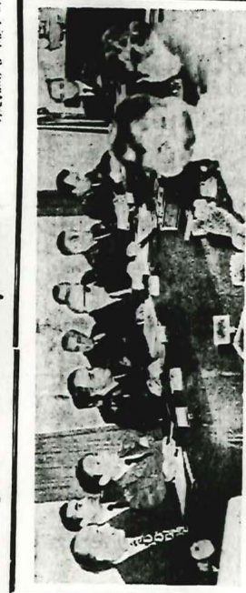
Üçak Sanayinin kurulması ile ilgili olarak önceki gün Hava Kuvvetleri Komutanlığı'nda bir toplantı yapılmıştır. Toplantıya konu ile ilgili Bakanlar, Hava Kuvvetleri Komutanı, Genelkurmay Başkanlığı temsilcisi, Devlet Planlama Teşkilatı Müsteşarı ve Bakanlık Müsteşarları ile Hava Kuvvetleri Güçlendirme Vakfı Genel Müdürü katılmıştır. Fotoğraf bu toplantıya tesbit etmektedir.

İSMİ AÇIKLANMAYAN BİR ORGNERAT'IN MUHABİRİNE DÜN BEYANAT VERDİ ANKARA (THA) Silâhli Kuvvetler Yüksek Komuta heyetinin, Genel Kurmay başkanına (Devamı 5. Sayfada)