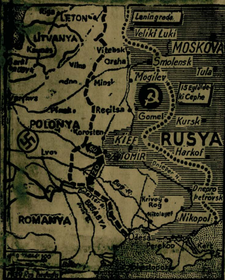
Dünkü telgrallara göre Rusya'da cephe hattı...