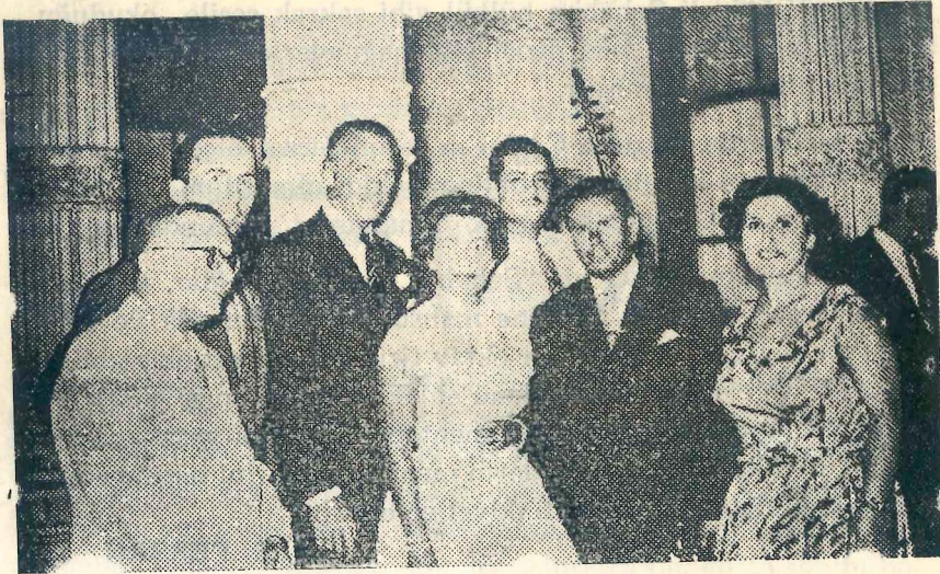
Atatürk filminin hazırlanmasını tetkik için Memleketimizi ziyaret eden artist Douglas Fairbanks Türk Musikisi Sanatkârlarile bir arada