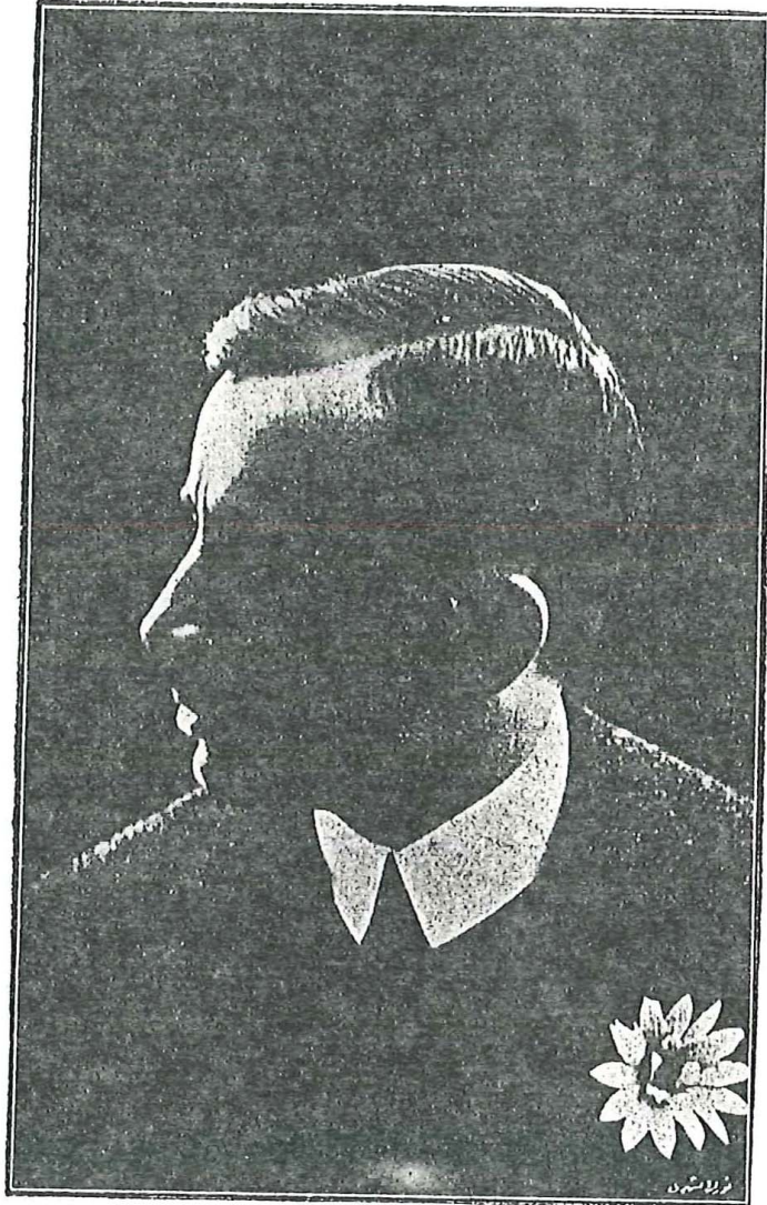
شادی فکرت بك

مائع اولوق جراتنده بولمىسه سزك دامادگىز اولوق شرفيله افتخار ايده جكم .