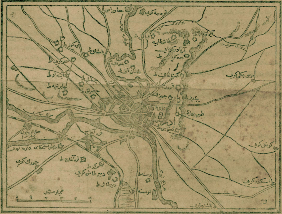
خریطة ۲ - ادرنه شهرى واستحكاماتى

ماتن غزته سندن نقل واستنساخ ايتديكز بو خريطه ده ادرنه نك اطرافنده اليوم عسكربه عنايه الله بولان موازى چيز كيلرايه ارانه اولمش وشهرى محاصره ايدن بولغاز قطعات عسكر به سى ايله صرب از قزلبلك موقلى دخی اشارات مخصوصه ايله كوستغرلشدر . بودن ماعدا ( طاش تپه ) ، ( قوش تپه ) ، ( شيطان تپه ) ، ( قزل تپه ) ، ( باياس تپه ) استحكاماتى كى ماتن غزته سى غزيرنك بخت ايتدى استحكاملرده كذا بر بر ارانه اولمشدر . شوقدر واركه بو استحكاماتك اكثريتك اساميسنه شمدى به قدر نظر تدقيقدن چيكرديكز ارکان حريمه خريطه لرند مصادف اوله مدق . نه كيم زرده درج ايتديكز « ادرنه واستحكاماتك » بيوك مقاسده كى خريطه سنده بو اسملرك اكثرينى بو قدر . حالبوكه بز او خريطه نى ، شمدى به قدر نشر ايتديكز ديكر لرى كى بر جوق اجنى خريطه لرى تدارك وتدقيق ايله وجوده كتيره شدك . بناء عليه اونك يا كلش اوله بيه چكته احمال و بره بزه اوله اوله مانك غزيرى ، اسملرك تحق قنده خطا ايتمشدر . مع مافه اسملر يا كلش ده اوله مقصد اصلى مار فريك موانع متقابل سنى ارانه دن عبارتدر . بو ده خريطه نك اشارات مخصوصه سيله كافى درجه ده تأمين اولقمده دو .