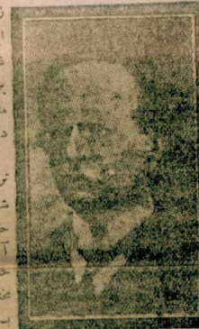
هلال احمرک مؤسسار بدن وک غیور خادم لر بدن رئیس ثانی دو قنور بسم عمر پاشا

نشریات انجمنک خدمتای ده تقدیر شایاندر . ملی آژانس مدیری حسین طوسون بک ، مطبوعات مدیری حکمت بک ، ثروت فنون صاحبی احسان بک ایدرک همای ده ستایشه لایق دور .