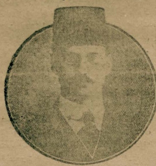
هلال احمر سر کیستیک ترتیب و الحضانل ایدن غیرتور لردن سر کی قومیسویون رئیس اسماعیل جانیولت بک

آلمان ، آوستریا - مجارستان و بلغار صلیب اجر لری سر کیستیکه بک اساسی بر صورتده اشتراک ایشلردور . هیئت طرفتندن نشر ایدیلن و یالکن رسم کشاده مخصوص اولان بر کوچیک رهبر سر کیستیک بتون سالونلری تفصیلاً تصویر و بو مفید ، مشهرک نظامنامه سی ده استوا ایشلکده در .