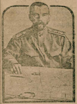
دوسلر چاری نیولا کندی قزراکه عجموشده