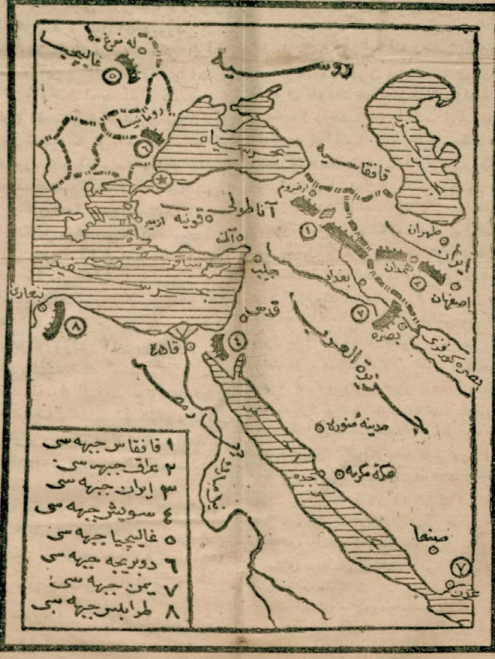
ایوم قاج چهده حرب ایدیبورز؟

حرب عمومی به دخولک ایکنجی سنه شام بولورق اوچنجی سنه به ایشادین بوکونده برآکنده قاج چهده بردن حرب ایکنجی و مختلف جهلرده کی وضعیت حربیه مزی کوستر