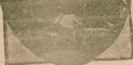
ولي عهد سلطنت دولتو نجابتو وحيد الدين افندي حضرتولي [ معاراليه حضرتولي هلال اجر جهتي رياست فخره سي لطفاً درعهده بوورمقده دولر ]

میدانلرینه ، جبسه لرك هان آرقه سنده طيب ، خسته باقچي ، جراح ، اجزاي دينان مسترز ، كوروليسز مجاهدشك متوع امراضه ، ياره لره ، ميروبوره ، كيزليدن كيزي به قواي محاربه عابنده بولسان عناصره قارش مبارزه سي كوستريوره . سركي ، اوروياده آجيلانلرك دوننده اولايوب بك فائده لي ، زاده سيه عمل و تطبيقدر . بو مشهري