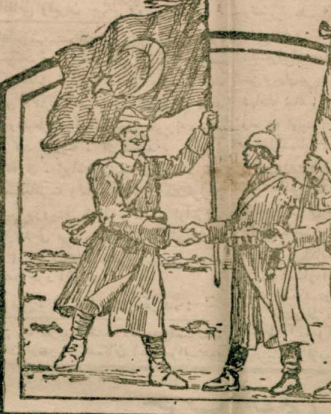
سه اول عینی کورنه ملتیز ، دول سرکیزیمه ت مظاهرت و اتفاقی اوزادرکن