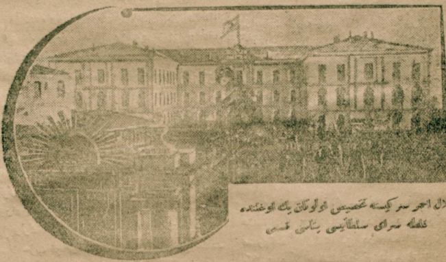
هلال اجر سر كيسنه شخصيني اولونلرني بك اوغوشنده كلفه سره سي سلطانيسي برنامي قسي

يدي سنه لك براهتم متايدنك محصولي اولوب تحت حمايه حضرت يادشاه ايده بولمقده مختصر و سبيلي بوزان هلال اجر جمعيتلرك سو ك مجلس عمر ميس ، رئيس ثاني معلم دوقتور بسم عمر پاشا ملكه تشكليه و تشييله ، قريات و اجرا ايتي كوسترمك اوزره استاتيووله بر سركي آجهه قزاق و برسي ايدي ؟