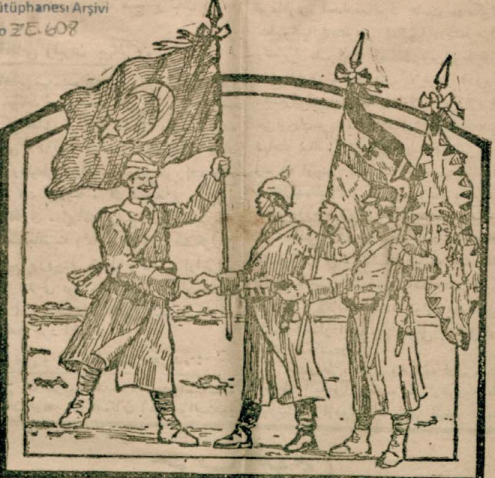
پوندن ایکی سنه اول عینی کونه سنن . دول مرکزیه دست مظاهرت و اتفاقی اوزاد برکن