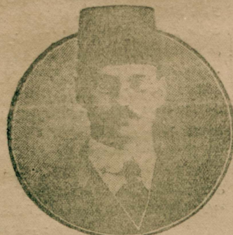
هلال اجر سر كيسي ترتيب و الحضانة ايديك غيرتورلندن سركي قوميسيوني رئيسي اسماعيل جابولت بك

نصريات انجمنك خدماتي ده تقديره شاياندر . ملي آژانس مدبري حسين طوسون بك ، مطبوعات مدبري حكمت بك ، ثروت فنون صاحي احسان بك افنديلرك همماتي ده ستايشه لاي قدر .