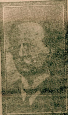
هلال احمر ك وؤسارلندن وك غيرت خادملرلندن رئيس ثاني دوقتور بسم عمر پاشا

زيارت ايده بك اولانر ، اولاً ، حرب جاننده اطبانك نه كي غيرتلي ايذاق ايستكاريني كوره جكار ، ثانياً ، حسيات شفقت و مرحمتولي غلبانه كله جكار . چوقدن بري ، ملكنزهده ، بو درجه انتظامده بر سركي كساد ايده همدى . نظر تقديرسي جلب ايدين سالونر ، منظره لر ، نمونه لر ، رسملر هب بيوك بر اعتنايه ، بر شيمه انتظامه دلالت ايتك اعتباريله معني داردر .